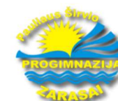
ZARASŲ PAULIAUS ŠIRVIO PROGIMNAZIJOS I-OJO AUKŠTO KABINETŲ IŠDĖSTYMO PLANAS