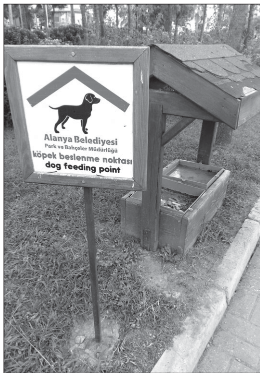
Šunų šėrimo vieta viename iš Turkijos parkų.

Kitas pastebėtas dalykas – šunims nėra jokių pramogų! Dėl šios problemos kreipiausi į ger-